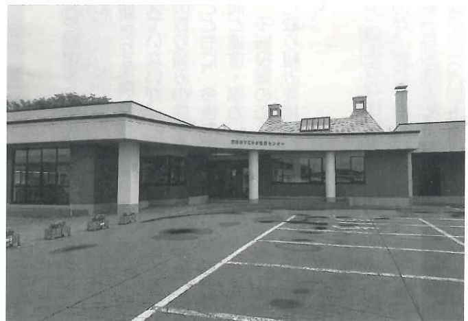
羽幌町地域包括支援センター (すこやか健康センター内)

問 「共助」については、在宅での生活支援や介護サービス、訪問看護の人材確保が必要となる。人材確保の今後の見通しについて。 答 介護サービス資格取得奨励事業助成制度があり、今後も一人でも多くの人材が介護の仕事に就いていただけることを願っている。道内では、外国人の採用を予定している自治体もあり、今後の課題として捉えている。