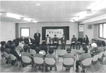
昨年度行った意見交換会

・商店等の経営者を対象として、意見交換会を開催することとした。詳細については、今後協議する。