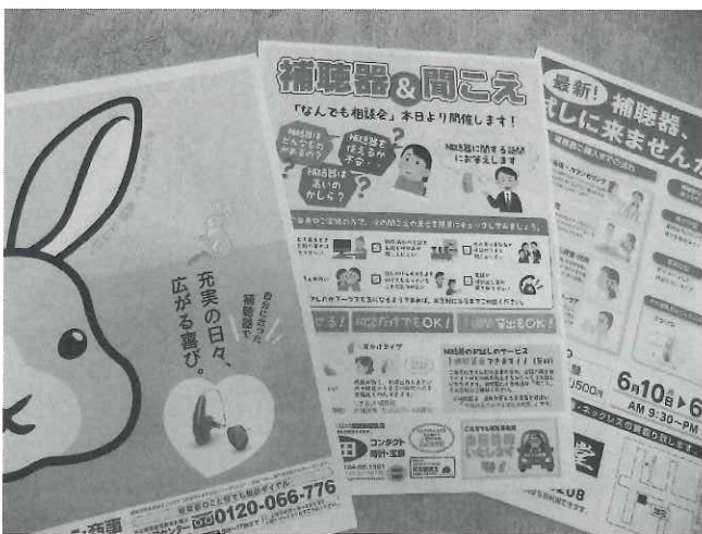
町内事業者による補聴器の広告

問 平成30年度末で約7128万円、28年度以降取崩しは行っていない。将来的に納付金財源の不足が生じた場合には、取崩しを行う必要がある。 問 国保料改定への検討や動きは。 答 納付金額が増加することにより保険料が増加することから、基金残高の状況等を踏まえた保険税率の見直しなど、町独自で保険料上昇を抑える方法も検討する必要がある。