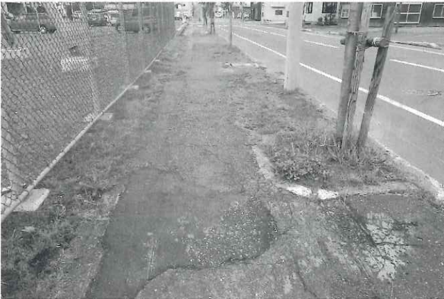
凹凸が激しい南3条通りの歩道

町道は、町民が安全で快適に利用のできる状態で維持管理されることが、町の責務であると考え、そこで南3条通りのうち、4丁目から6丁目間を全面的に改修工事を早急にするべきと考えるがどうか。