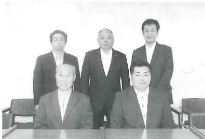
広報広聴常任委員会の委員