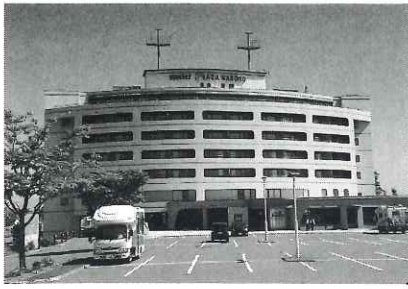
いきいき交流センター (はぼろ温泉サンセットプラザ)

・繁忙期の室料の増額及び消費税増額分の転嫁 ・現状に合わせ客室区分をシングルルーム等に整理