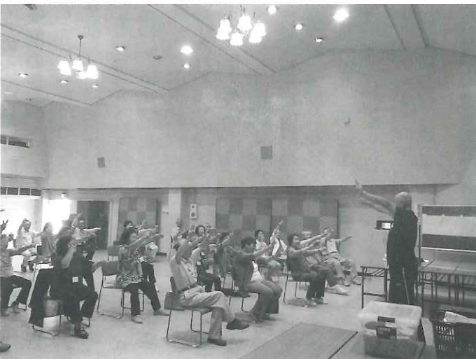
コーディネーショントレーニング

問 「互助」について、市民の健康づくりに向けた現在の取り組み状況は。 答 健康づくりの動機づけとして「羽幌町健康マイレージ事業」を昨年4月より実施している。 問 ここ最近の特定検診の受診率は。 答 今年5月に行われた婦人科検診は、昨年と比較し40名増となった。