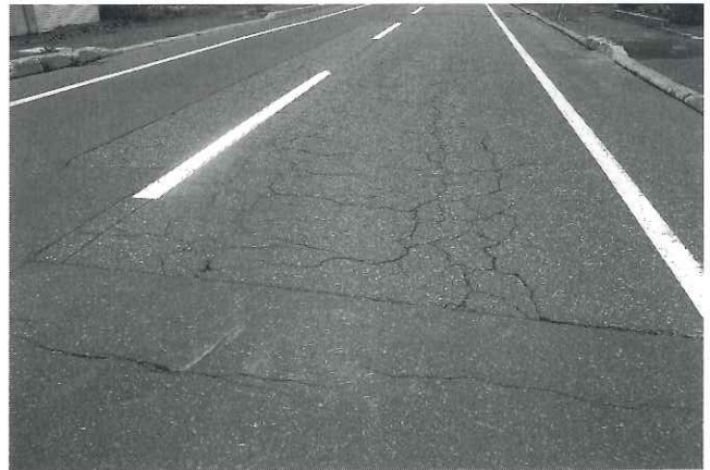
ひび割れが目立つ南3条通りの車道

問 町内における平成30年度の個人住宅の新築件数は、7件あったものの、この内町内建築業者を活用しての新築は2件のみであった。住宅の新築は、人生で一度有るか無いかの多額の消費活動である。地域住民の地元での消費活動により、地域の経済が活性化され、そのことが町の発展につながる。特に地元産業を活用することは、雇用の創出や税