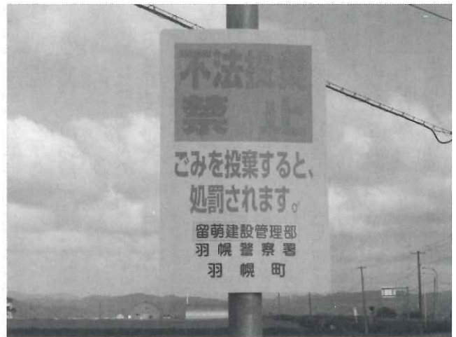
不法投棄禁止の看板

問 ポイ捨てを防止するため、独自施策として規制を含む条例を定め、町民憲章にある自然を愛し、平和で美しい町にするため取り組んでいくべき。新たな防止対策として、