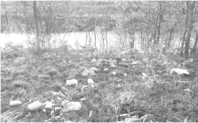
ポイ捨てされたゴミ

ポイ捨ては景観を損ねるだけでなく自然環境破壊につながる行為であり、特にビニール・ポリ系のゴミは分解されることも無く、川から海へ流れつき魚や鳥などが、誤って