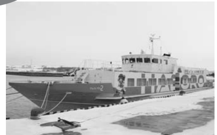
新高速船「さんらいなあ2」