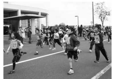
おろちゃんマラソン大会