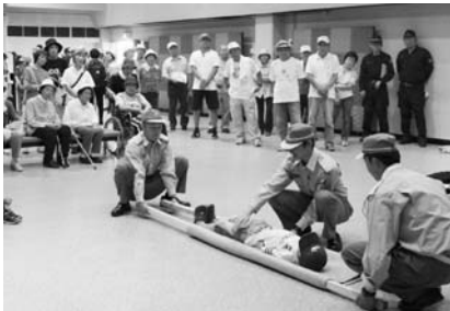
平成24年度の防災訓練

避難場所や避難所に海拔（標高）表示板や避難所表示板を設置し津波災害に対する防災意識を高めます。