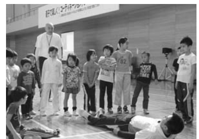
コーディネーショントレーニング

・コーディネーショントレーニング教室 ・水泳教室 ・羽幌小学校プールの開放 ・スキー場フェスティバルの開催