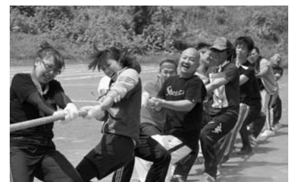
天売島民大運動会