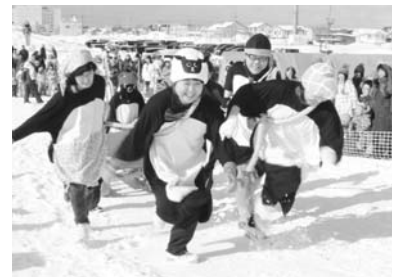
おろろんウィンターフェスティバル

・少年少女卓球教室、卓球大会 ・パワデールフェスティバル ・オロロンライン全道マラソン大会 ・おろちゃんマラソン大会 ・おろろんウィンターフェスティバル