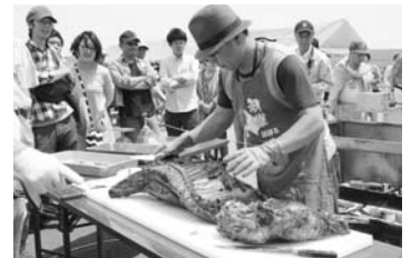
焼尻めん羊まつり（平成24年度）