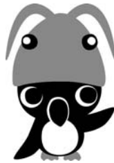
羽幌町のPRキャラクター「オロ坊」