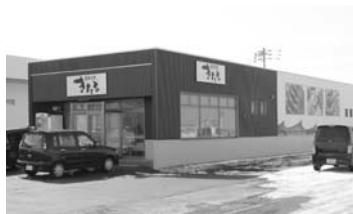
漁協産直工房「きたる」

平成24年度で整備した直売所について、今後、商工会、観光協会と連携してマーケット開拓を進めるために顧客管理、発送管理、在庫管理などを行うためです。