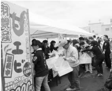
「はぼろ甘エビまつり」第2回目も4千人の入りこみで、大盛況でした。