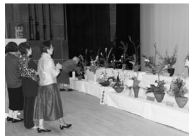
町民芸術祭(展示部門)