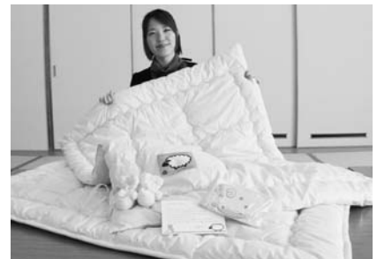
メッセージカードと手編みのベビーシューズをつけてプレゼントします

赤ちゃんの誕生を祝うとともに健やかな成長を願い、焼尻めん羊の毛を使ったベビー布団を作成し、プレゼント。子育て環境を整えるとともに、地域への愛着を深めます。