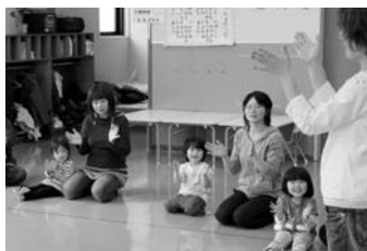
うさこちゃん遊びの広場