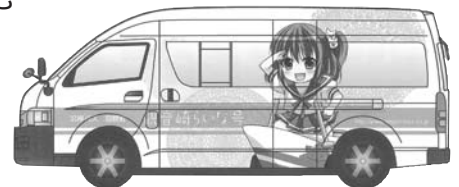
【シャトルバスのイメージ図】

定員13名の小型バス。車体には、沿岸バスの「萌えっ子フリーきっぷ」のアニメ風美少女キャラクタの一人「観音崎らいな」が描かれています。