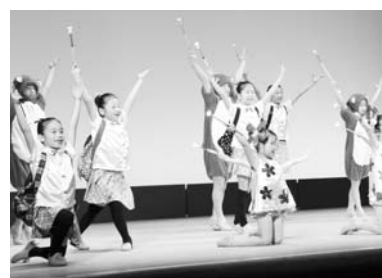
町民芸術祭(舞台部門)