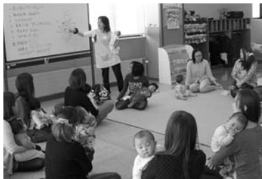
乳幼児育児教室「あいあいサ〜クル」