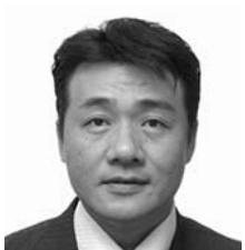
与田 剛 氏

日時 9月6日(日) 午後1:00～午後4:00(予定) 会場 スポーツ公園 野球場 A球場 雨天時/羽幌町総合体育館「パウデール」 講師 与田 剛 氏 (NHK野球解説者) 田口 壮 氏 (野球解説者) 受講者 羽幌町を中心とした小学校4・5・6年生 受講者はすでに決定しています。 観覧 自由に観覧できます。