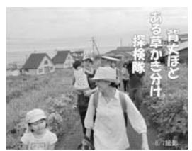
焼尻島を詠んだ俳句がたくさん集まりました！