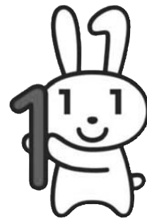
マイナンバーキャラクター 「マイナちゃん」です