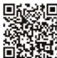
自衛隊旭川地方協力本部ホームページQRコード