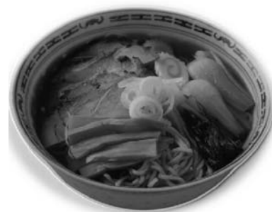
チャーシューメン 食塩量 5.5g

男女別以外で、高齢者は「漬物や梅干し」、若年層は「せんべいやポテトチップス」の摂取頻度が多いことなど特徴がみられました。