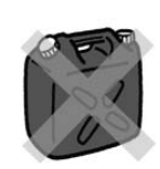
灯油用 ポリタンク

灯油用ポリタンクは静電気が滞留しやすく非常に危険です！絶対にガソリンを入れないでください！！