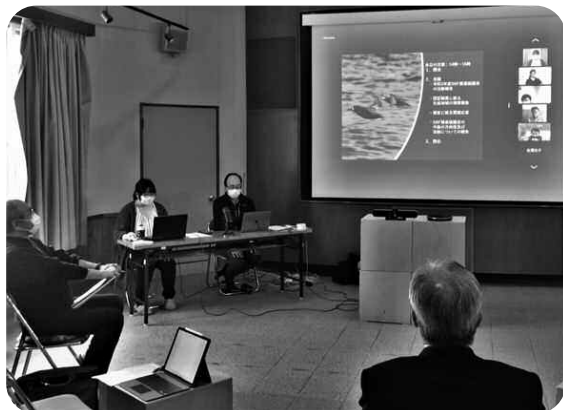
オンラインで活動報告や意見交換を行いました

環境教育や環境にやさしい事業者の支援、地域づくりを応援してくれる人を増やす仕組みづくりなど、これから様々な取り組みを進めていきます。そのために、来年度もたくさんの方々と力をあわせて「自然環境を大切に作る地域づくり」に取り組んでいきたいと思えます！