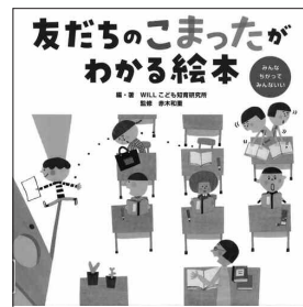
友だちのこまったがわかる絵本 WILLこども知育研究所/編・著 金の星社

「なんで？」って思うことする子、いるよね。でもそのお友だち、じつは困っているのかも？ どんなきもちなのかココロの電話できいてみようよ。