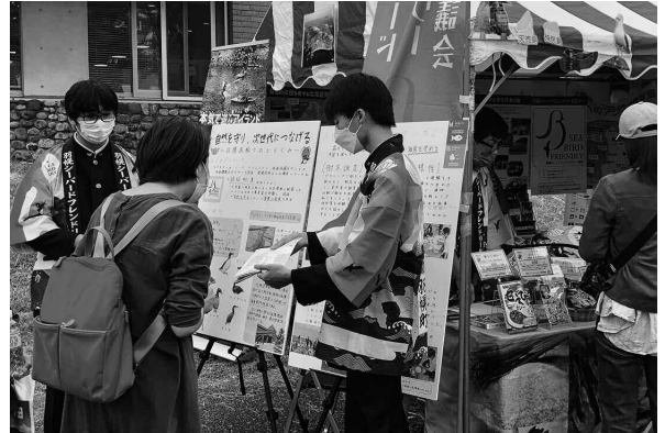
SBFのはっぴを着て来場者に説明を行う羽幌高校生

海鳥や地域の環境を守る取り組みに協力するSBF認証団体の北るもい漁業協同組合の甘えびカレーや甘えび出汁、上築有機米生産組合のお米などの販売も行い、とても好評でした。