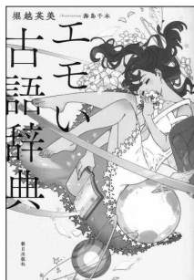
エモい古語辞典 堀越英美/著 朝日出版社

エモさにふるえても 語彙力を喪失したくない。 むしろ語彙力で エモさを増幅させたい。 これはそんな人のための 辞典です。