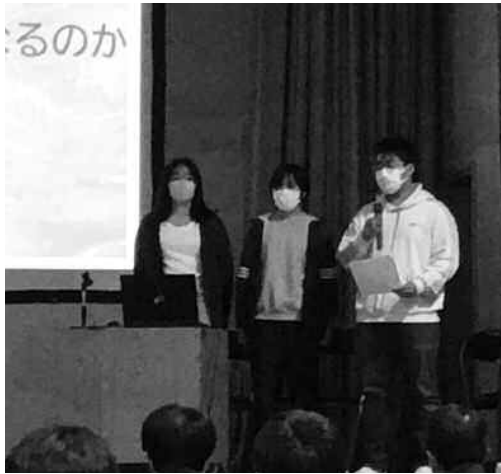
天売高校1年生の発表風景

10月22日(土)、天売高校の高校生のみなさんが、水産業をテーマとして研究した成果を島民のみなさんに発表しました。発表したのは全部で5チーム。それぞれのタイトルは①「海とプラスチック～天売島を守っていく～」②「生息地以外の海水でガヤを育てるとどうなるのか」③「ハッチャン」④「MPsはどこからくるのか」⑤「プロジェクト天売～稚貝の放流でアワビを救う～」で、テーマは多岐に渡っていました(記載は発表順。一年生の発表は②③、二年生の発表は①⑤、三年生の発表は④)。