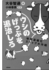
ウシのげっぷを退治しろ 地球温暖化ストップ大作戦 大谷 智通 / 著 旬報社

本書の主役は「ウシ」です。そのウシの「げっぷ」が今、地球温暖化対策のカギとなっているのです。