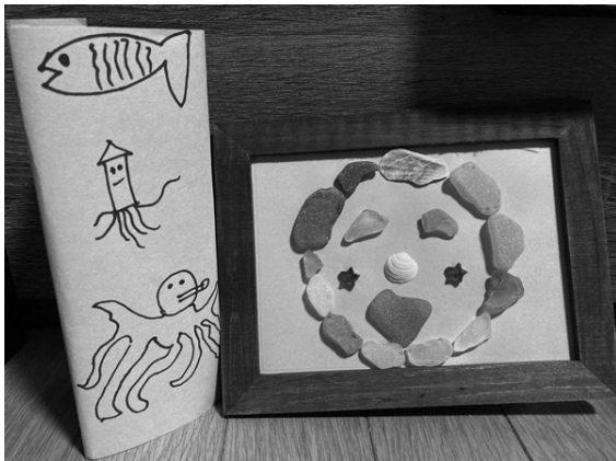
ワークショップのサポートに入ってくれた、高校生の作品 シーグラスで作った笑顔が素敵です

(*) 8月4日、「天売島のシーグラスでつくろう!」と題して、子ども向けのワークショップを開催しました。参加者は小学生4名とサポート役の高校生1名。途中、保護者の方も参加してくださいました。ワークショップでは、細かなビーズを使った万華鏡や、シーグラスを使ったシーグラスアートを作りました。子どもたちが作業で困っている時には高校生が作り方を教えるなど気遣いをし、素敵な作品ができました。ワークショップは1時間半程でしたが、あっという間に楽しい時間が過ぎて行きました。参加してくださいました皆さん、シーグラスの提供とサポートいただいた高校生たち、お手伝いいただいたHAPRUのアクセサリ作家さん(天売島在住)、ありがとうございました!