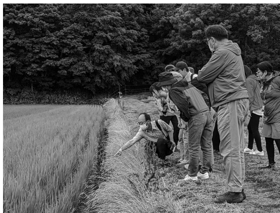
水田見学の様子(羽化したばかりのトンボを見つけました)

環境保全の取り組みは、少しの積み重ねを長期継続していくことが必要です。今後もプロジェクトを応援していただける方のつながりを大切にしていきたいです。