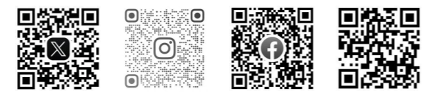
X(旧Twitter) インスタグラム フェイスブック 病院ホームページ

病院の診療に関する最新の情報は、病院ホームページや公式SNSで案内しています。ぜひフォローをお願いします。