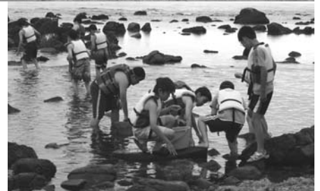
海水浴場で海遊び。カニや小魚など海の生き物を観察です。羽幌ではなかなか見られない大きなヤドカリにおどろきの声も。