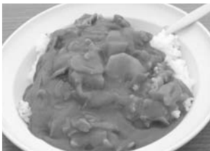
(右)羽幌港出航直前の一枚。これからフェリーに乗り込み、一泊二日の旅が始まります。 (中)料理だって自分達でやっちゃいます。鍋さばきもお手のもの。左手には予備の薪？ (左)出来上がった夕食のカレーライス。人参もしっかり入って彩りもきれいでした。もちろん味だっておいしかったですよ。