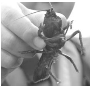
キャンプ場横手の沢で捕まえたザリガニ。写真ではちょっと見づらいますが、ハサミもあります。

子ども達の中にはザリガニを初めて見る子もいて、自然とのふれあいに目を丸くしていました。