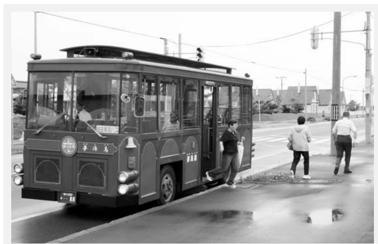
夏期間限定で運行するレトロ調バス「夢海鳥(ゆめみどり)」