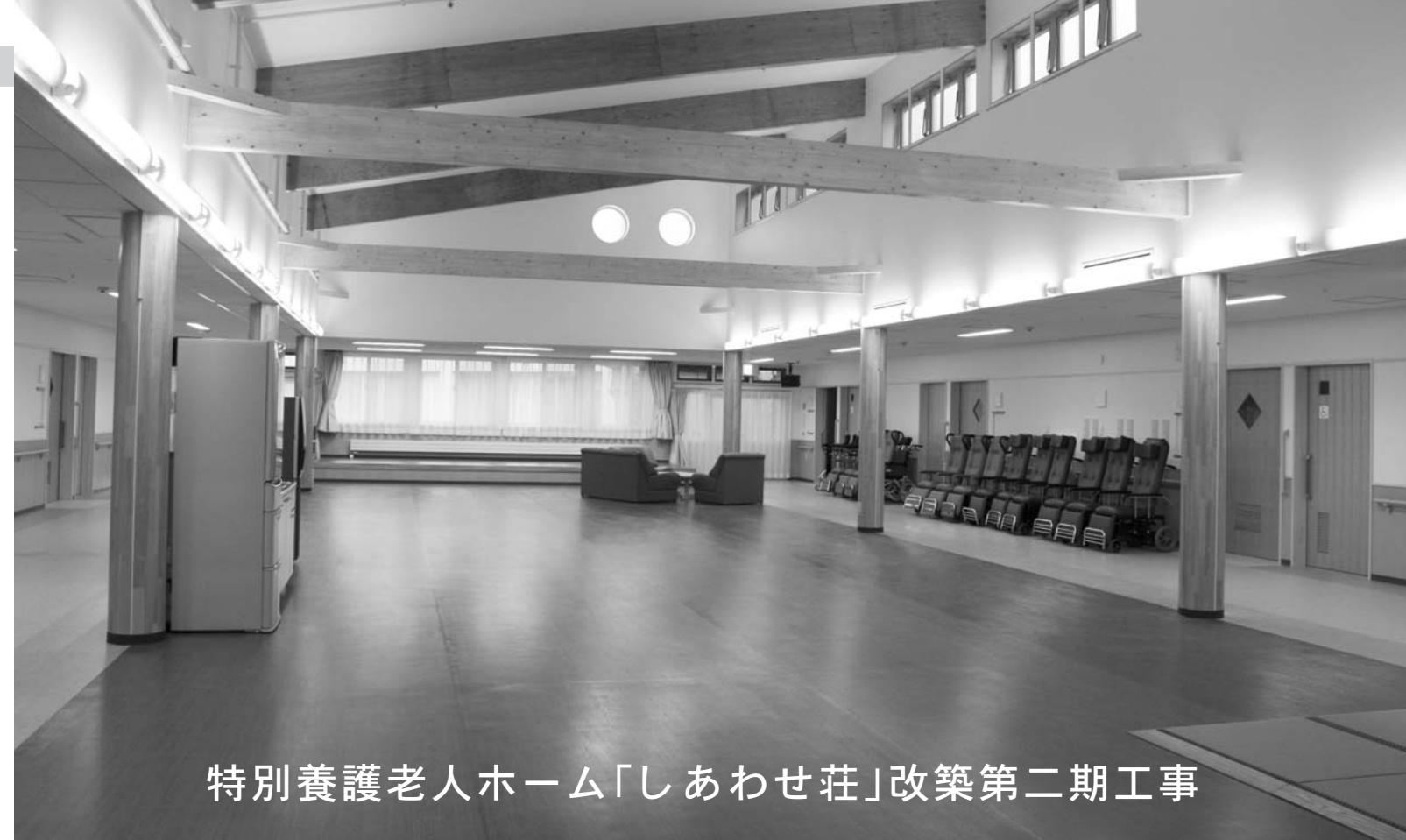
特別養護老人ホーム「しあわせ荘」改築第二期工事