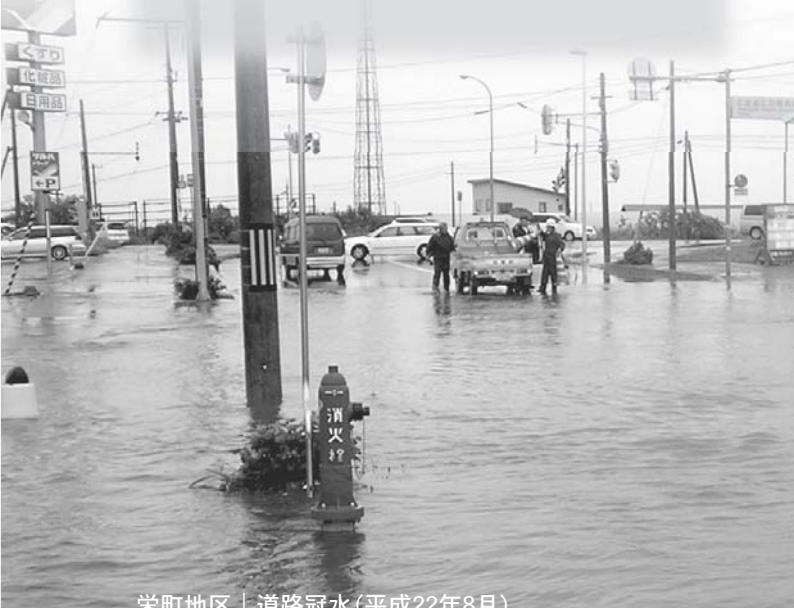
栄町地区 | 道路冠水(平成22年8月)