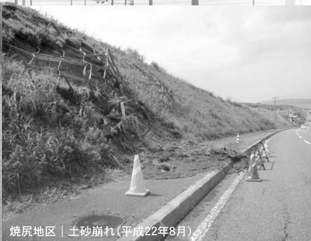
焼尻地区 | 土砂崩れ(平成22年8月)