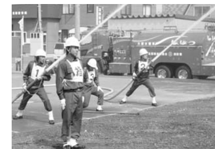
昨年のポンプ操法訓練の様子