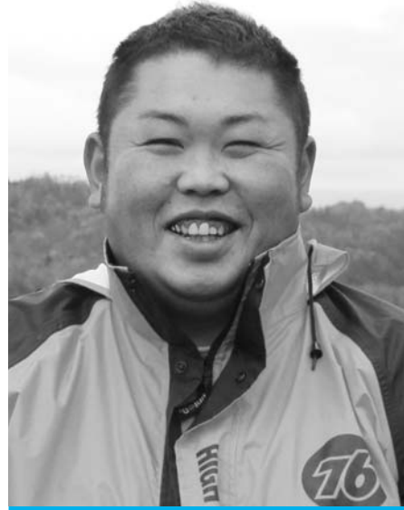
羽幌町ピンクファイブ 代表