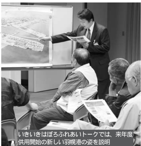
いきいきはばろふれあいトークでは、来年度供用開始の新しい羽幌港の姿を説明

◆駐車場の広さは？ アクセス道路はどうか？ 大型車の通行は大丈夫か？ ▼駐車場は、ターミナルに140台。漁協前に25台。足りなければ、漁協裏の町有地を考えています。 アクセス道路は、