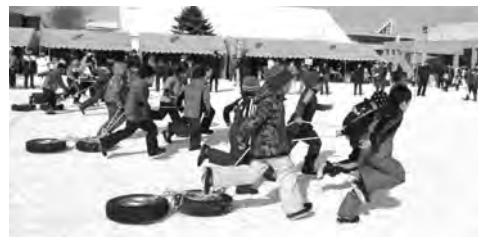
おろろんウィンターフェスティバル