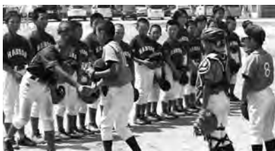
平成28年度は羽幌野球スポーツ少年団が内灘町を訪問。内灘マリナーズと交流を深めました。

姉妹都市「石川県内灘町」と文化・スポーツ団体の交流を通して両町の絆を深めます。今年度は内灘町の団体が本町を訪れます。