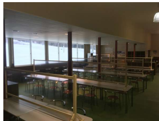
コロナ感染症予防対策